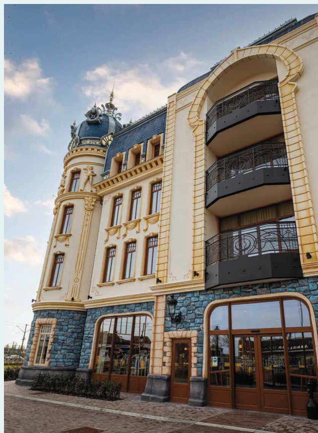
Grote raampartijen en deuropervlaktes geven het gebouw een groteske uitstraling

Door gebruik te maken van de A-TS modulair is het mogelijk om een deurhoogte te halen tot 3100 mm. Deze A-TS meerpuntssluiting die modulair verlengbaar is, zorgt voor perfecte vergrendeling waardoor de deur over de volledige hoogte afgesloten is. Dit zorgt dat tocht en vocht buiten blijven en het voorkomt kromtrekken. Omdat de A-TS automatisch vergrendelend is, is het ook voor hotels een zeer praktisch slot. De deur is op afstand te bedienen en door gebruik te maken van de dagstandfunctie kan de deur worden opgeduwd zonder sleutel. Ideaal voor een hotel waar veel inloop is.